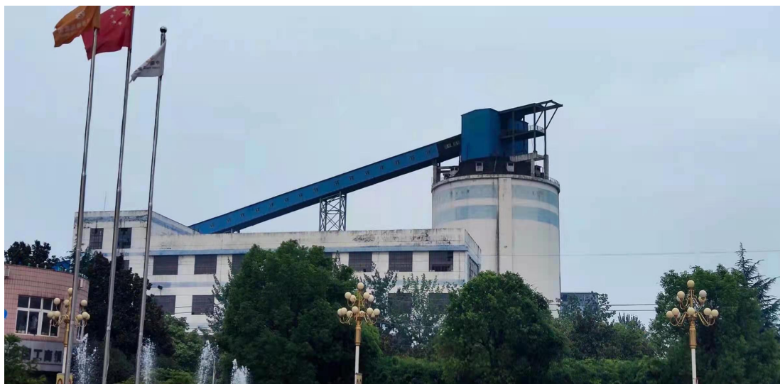
图 1 平煤十三矿地面 3 万吨煤仓外观图

煤仓每次放煤高度控制在 1.2-1.7m，由机电五队配合放煤；为保证通风安全，从煤仓上口观察孔备用一趟 4 寸风管，风管深入煤仓长度不小于 5m；在施工期间，若风机异常停风，必须立即打开风管正常通风，确保现场施工人员安全及时撤离煤仓；现场安设一部 5T 慢速绞车，配合自制吊篮进行人员和材料升入仓，每次只准升降 1-2 人”。维修队采取班前会上学习提问的方法学习贯彻《地面 3 万吨煤仓清理安全技术措施》，没有集中组织专门学习。维修队于 3 月 15 日开始清仓，4 月 15 日清理距煤仓下口约 10m 位置时发生了此次事故。