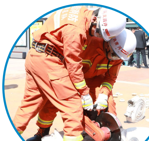
为强化消防产品监督管理,净化消防产品市场环境,切实消除因产品质量问题造成的火灾隐患,3月14日,市消防救援支队联合我市工商部门开展了消防产品流通和使用领域专项检查和伪劣消防产品集中销毁行动。图为销毁现场。