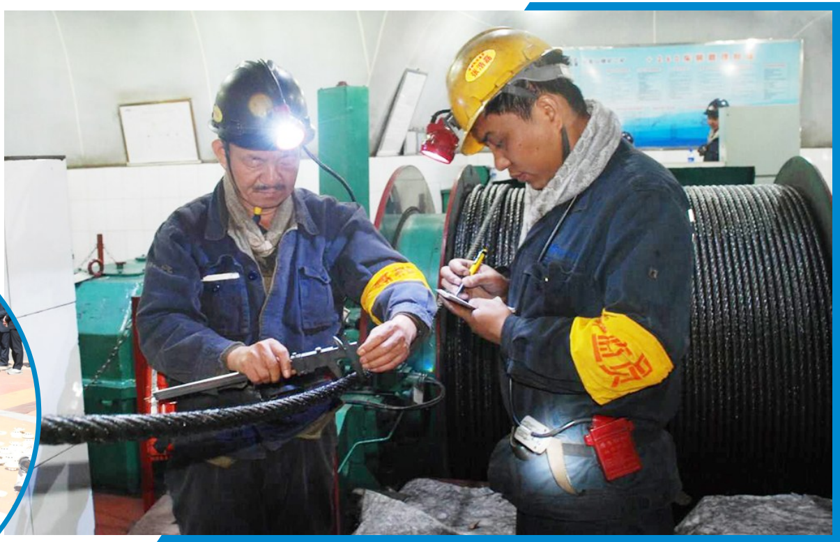
为充分发挥群监员在安全生产中的监督检查作用,确保矿井安全生产,3月18日,永锦能源云煤二矿工会组织特聘群监员集中开展上岗督查活动,分别对采掘工作面、机电运输等系统进行了安全隐患排查。图为群监员正在检查井下提升系统的钢丝绳的技术参数和质量。